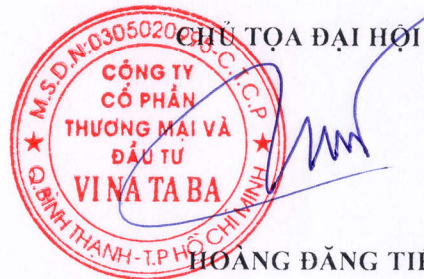
HOÀNG ĐĂNG TIẾN